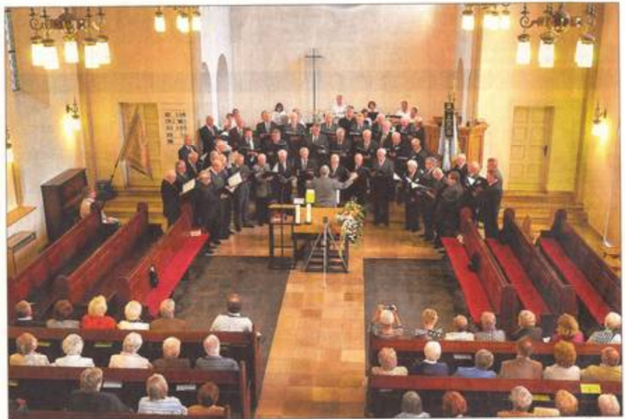
Ein gelungenes und gut besuchtes Jubiläumskonzert: Am Sonntagnachmittag hieß es „125 Jahre MGV Cäcilia Boele 1886“ in der Philipp-Nicolai-Kirche.

artenwechsel war beim Einüben sicherlich ein „harter Brocken“ gewesen, gelang aber gut mit dem Dirigenten am Klavier. Ein schwäbisches Volkslied mit Echo-Einlagen träumte von alten Zeiten. Nach dem Schlusstext vom „Bettele“ = Bettchen versank man in vielsagendes Summen: Da war doch noch was? Richtig in Fahrt kamen die „Jungs“ (Durchschnittsalter: 71,66 Jahre) im Musical-Block. Temperamentvoll und mit fetzigen Rhythmen schmetternden sie Songs wie „Wunderbar“ aus „Kiss me Kate“. Auch „Ein Freund, ein guter Freund“ (Die drei von der Tankstelle) und „Das gibt’s nur einmal“ (Der Kongress tanzt) wurden stürmisch bejubelt. Das Akkordeon-Orchester verschaffte den Sängern Verschnaufpausen, war aber keineswegs Lückenbüßer. Titel wie „Musik“ und „Sous le ciel“ (Unter dem Himmel) steckten